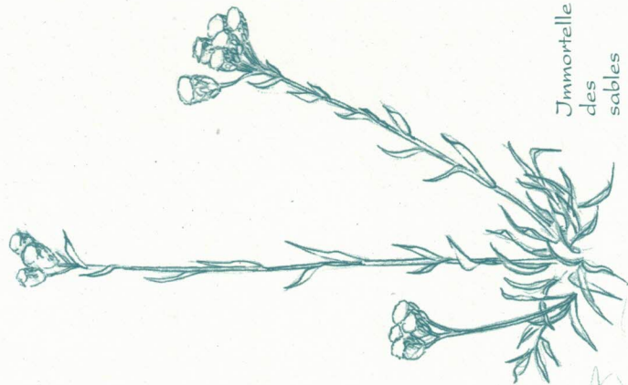
Immortelle des sables

Les façades des maisons donnent un aperçu de la taille du grès, matériau privilégié pour la construction sur tout ce plateau. Achever le circuit avec une visite de l'église Saint Martin : de style roman, elle fut édifiée au début du x e siècle