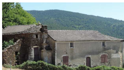
> Le mas Chanel, encore appelé ainsi de nos jours, où fut créée la base du logo à la renommée internationale.