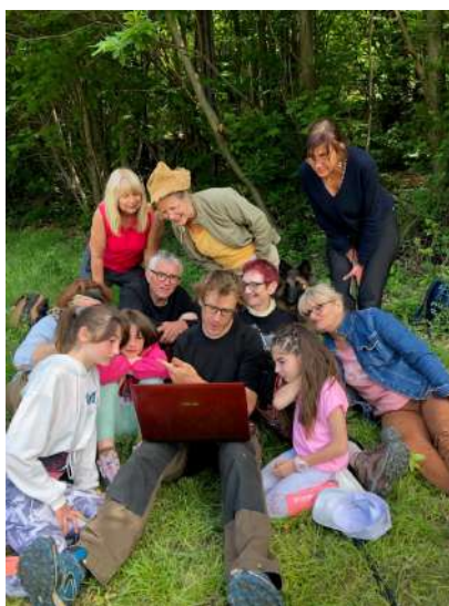
Relevé de la caméra par Manu Jacquet