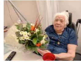
La doyenne de l'EHPAD 101 ans

Le CCAS continue d'honorer les aînés de plus de 90 ans de la commune et résidents de l'EHPAD. Cette attention est très appréciée de tous (habitants, résidents et encadrants) et permet de partager un bon moment de convivialité.