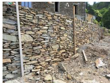
Mur de soutènement Parking au Bouchet de la Lauze