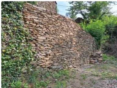
Mur de soutènement Rue de Besses