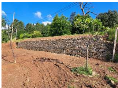
Mur de soutènement Route de Montselgues

Tout le programme 2023 d'entretien de la voirie touche à sa fin. Il reste encore quelques trous à boucher. Nous allons commander un semi-remorque d'enrobé à froid ce qui permettra à nos agents communaux de les traiter cet été. Vous trouverez, ci-dessous, quelques réalisations de prestataires sur des murs de soutènement de routes.