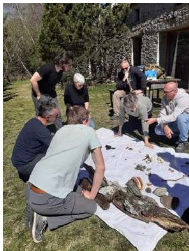
Animation champignons au Mas de la Barque le 11 mai