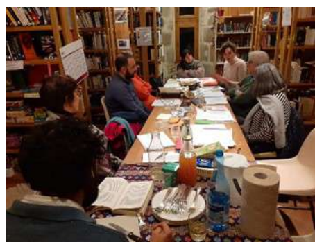
Animation arpentage à la bibliothèque le 30 janvier

... les lucioles projettent SI TOUT VA BIEN pour la jeune association, la programmation suivante pour l'automne et l'hiver :